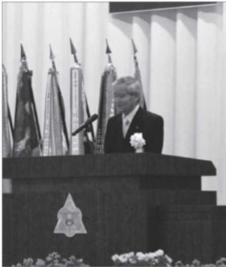
理事長告示（城西高校校長先生代読）